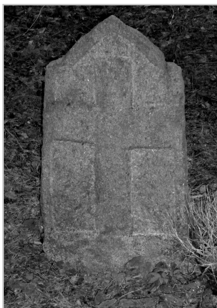
Fot. 1. Kamienny nagrobek bez napisów na nieużytkowanym cmentarzu luterzańskim we wsi Kocioł Duży (nadleśnictwo Pisz), fot. S. Sobotka 2014

Źródło: opracowanie autorów; modyfikacja kryteriów oceny zawartych w: A. DŁUGOZIMA, I. DYMITYRSZYN, E. WINIARSKA (2012).