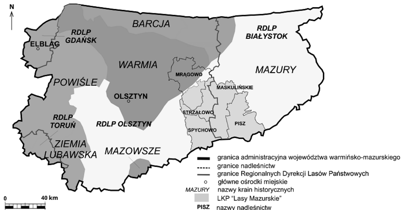
Rys. 1. Historyczne krainy na terenie województwa warmińsko-mazurskiego z zaznaczonymi granicami nadleśnictw, wchodzących w skład Leśnego Kompleksu Promocyjnego „Lasy Mazurskie”

Środkową i północno-wschodnią część tego kompleksu zajmuje Mazurski Park Krajobrazowy, który utworzono w 1977 r. Jego powierzchnia wynosi 53 655 ha.